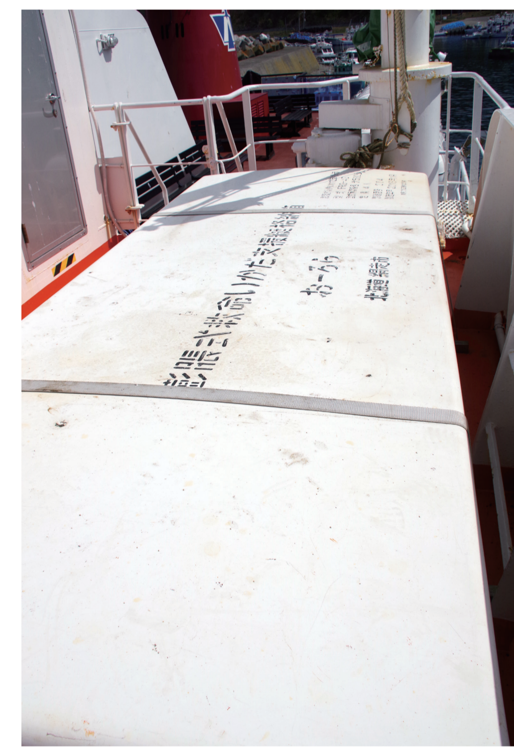
ぼうちょうしききゅうめいいかだえんてい 膨張式救命筏支援艇