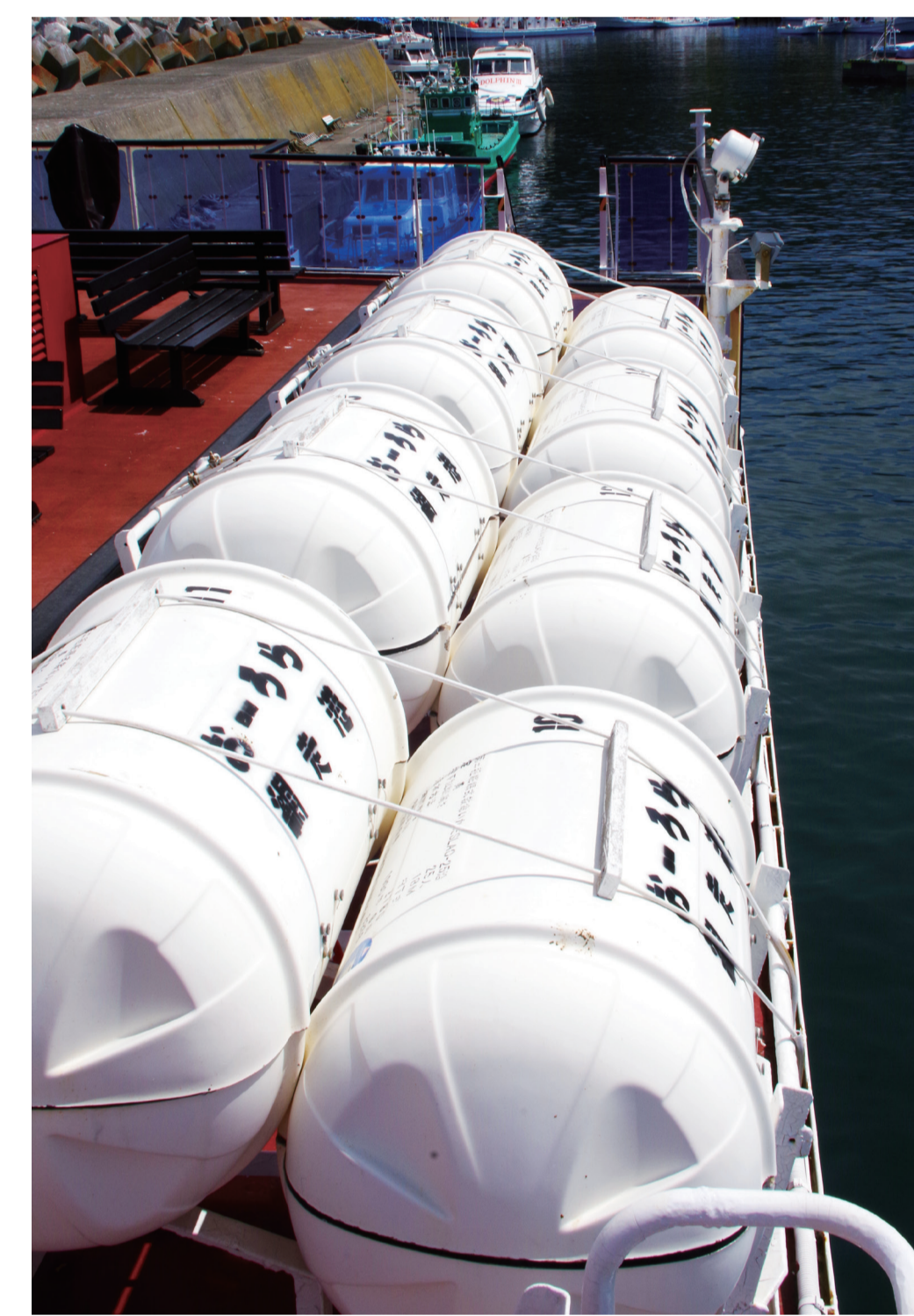
ぼうちょうしききゅうめいいかだ 膨張式救命筏