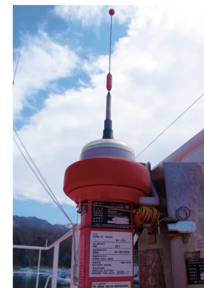
衛星 EPIRB (非常時位置指示 無線標識装置)