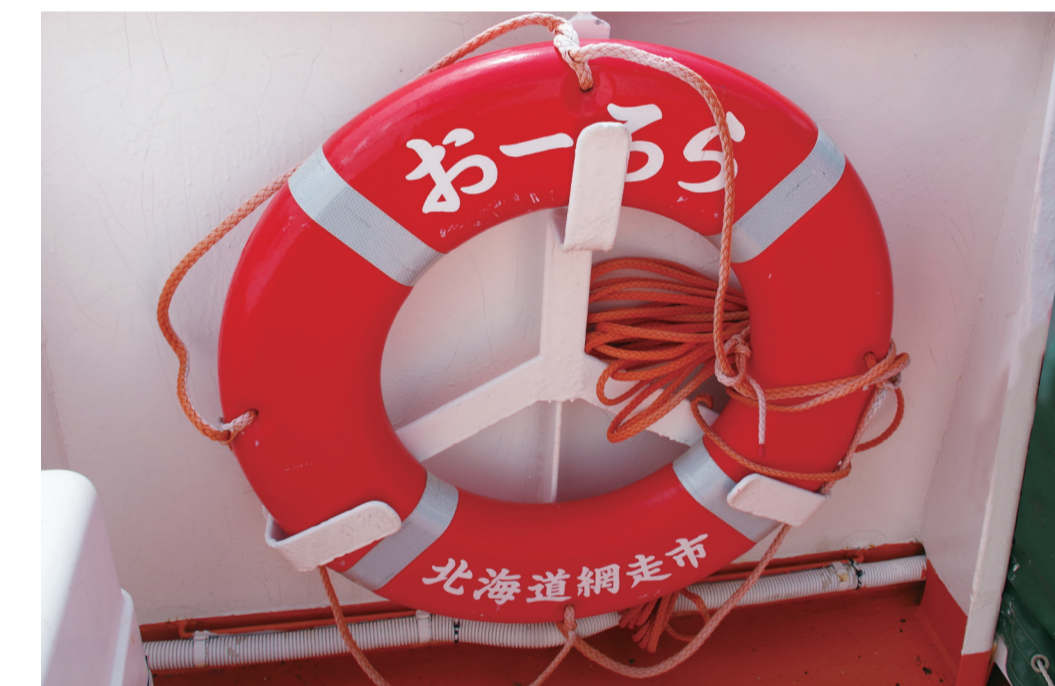
きゅうめいふかん 救命浮環