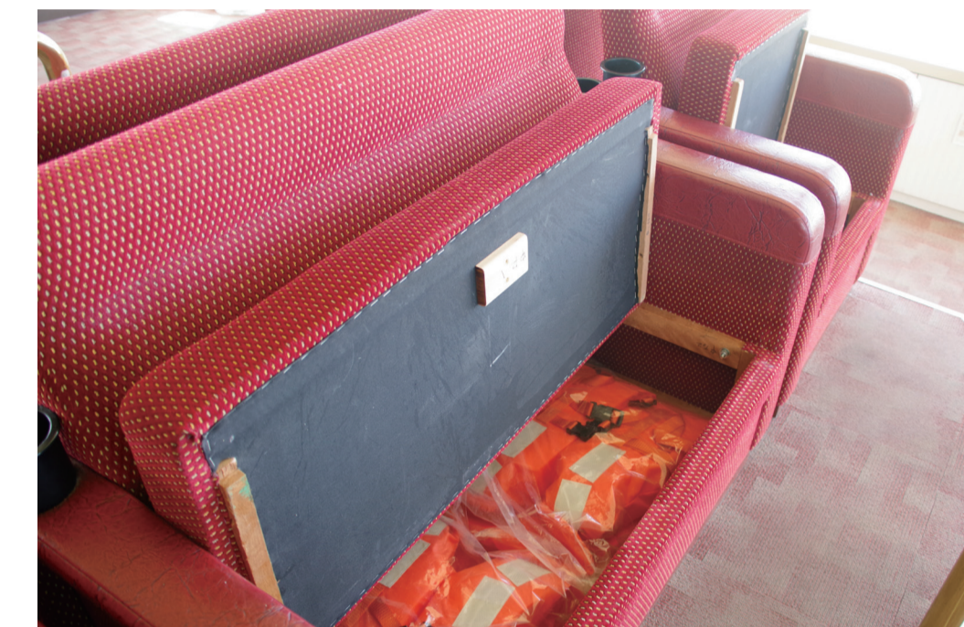
きゅうめいどうい 救命胴衣

最大定員数分（390名）の救命胴衣・救命筏 他、救命時の設備を搭載しております。