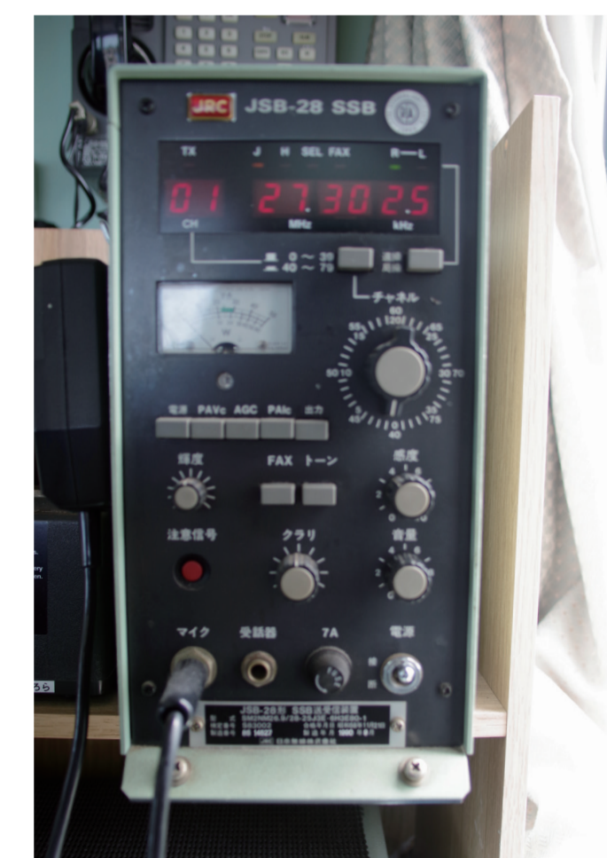
27MHz 帯 SSB 送受信装置