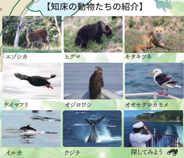
【知床の動物たちの紹介】