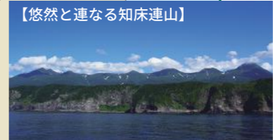
【悠然と連なる知床連山】